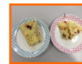
ひなクレープ 今年も？