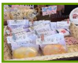
病院祭 完売しました